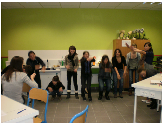
Réaliser des flexions pour évaluer les modifications de l'organisme durant l'effort (5 ème )