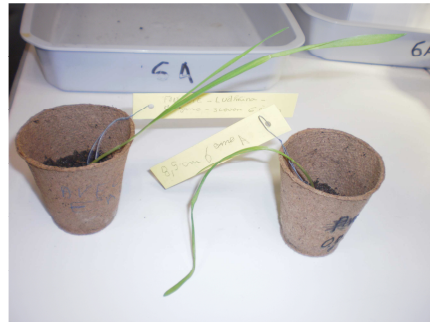
Besoins des végétaux et croissance du blé (6 ème )