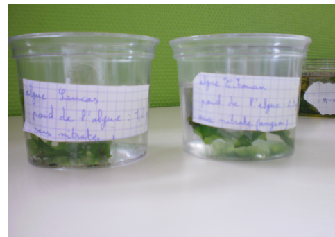
Besoins des végétaux et algues vertes (6 ème )