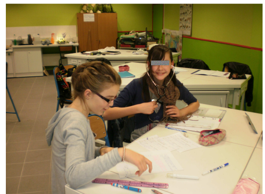
Ecouter le cœur et mesurer le rythme cardiaque (5 ème )